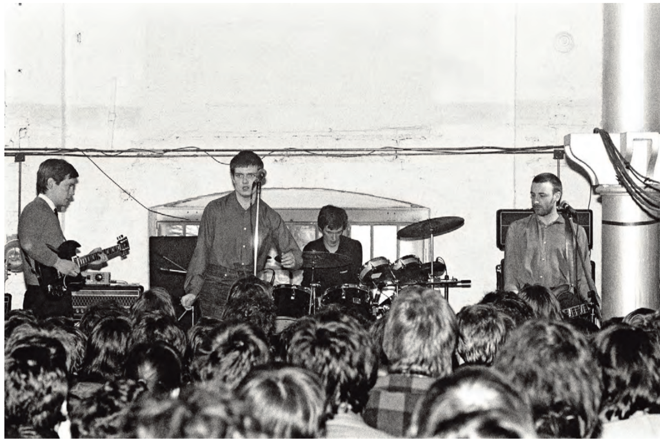
► Joy Division tijdens hun eerste buitenlandse optreden eind 1979, in Plan K.

► Casey Affleck speelt de sterren van de hemel.